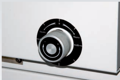
Nivelación de la mesa para conformado de lomo