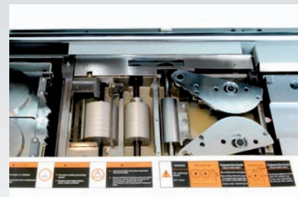
Dos tanques de cola: lomo y cortesía