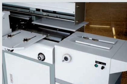
Hendidos de cortesía laterales, posteriores al encuadernado