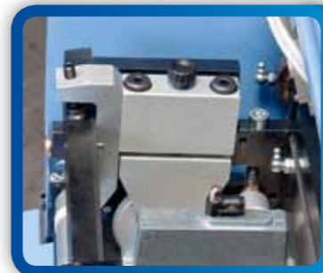
2 Ruota di pressione carta Wheel to press paper