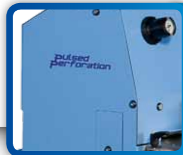
3 Riduttore di pressione con manometro Pressure adapter with manometer